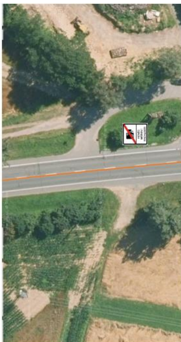
Foto umístění SDZ IP31b ve směru od Žďáru nad Sázavou