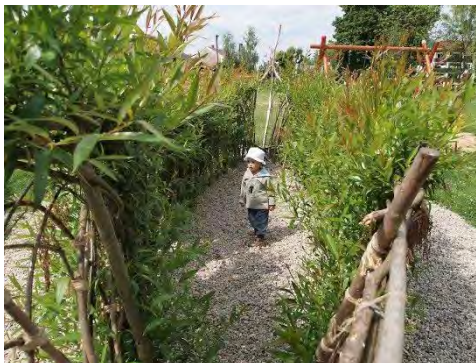
Obr. 41, 42: Vrbové teepee