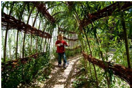
Obr.39, 40: Vrbový tunel