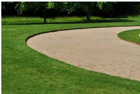
Obr. 1: Mlat