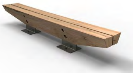
Obr.23: M 02b Lavička bez opěradla – okraj obce (ke Stržanovskému rybníku)