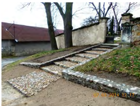
Obr. 10: Kamenné schody u kaple