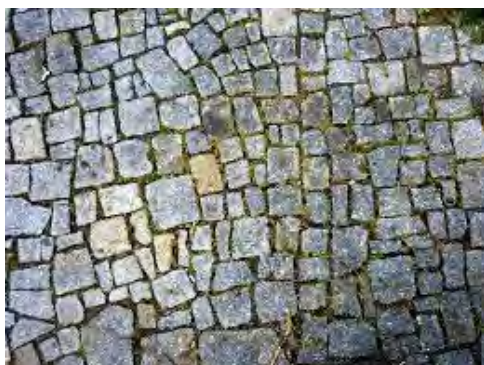
Obr. 2, 3: Kamenná dlažba