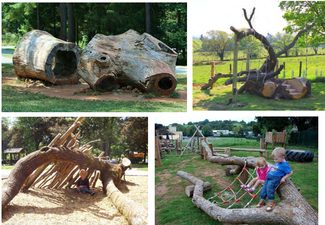
Obr. 35-38: M 09 Přírodní sezení a herní prvky – padlé kmeny, průlezka z padlých kmenů