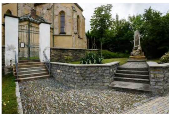
Obr.4, 5: Přírodní kamenná dlažba se zelenou spárou